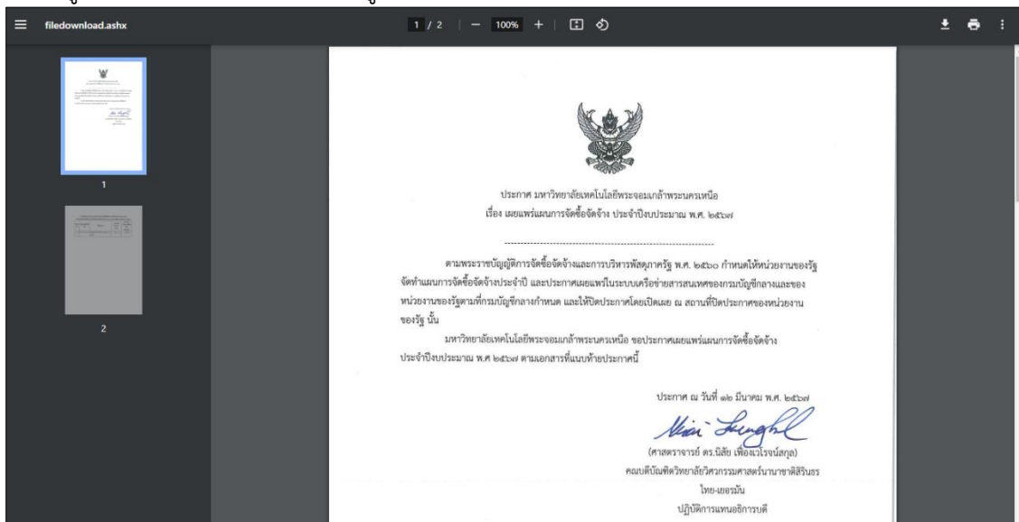
รูปที่ 4 แสดงหน้าจอข้อมูลรายละเอียดของประกาศในรูปแบบไฟล์ PDF

4. แสดงข้อมูลรายละเอียดของประกาศในรูปแบบไฟล์ PDF